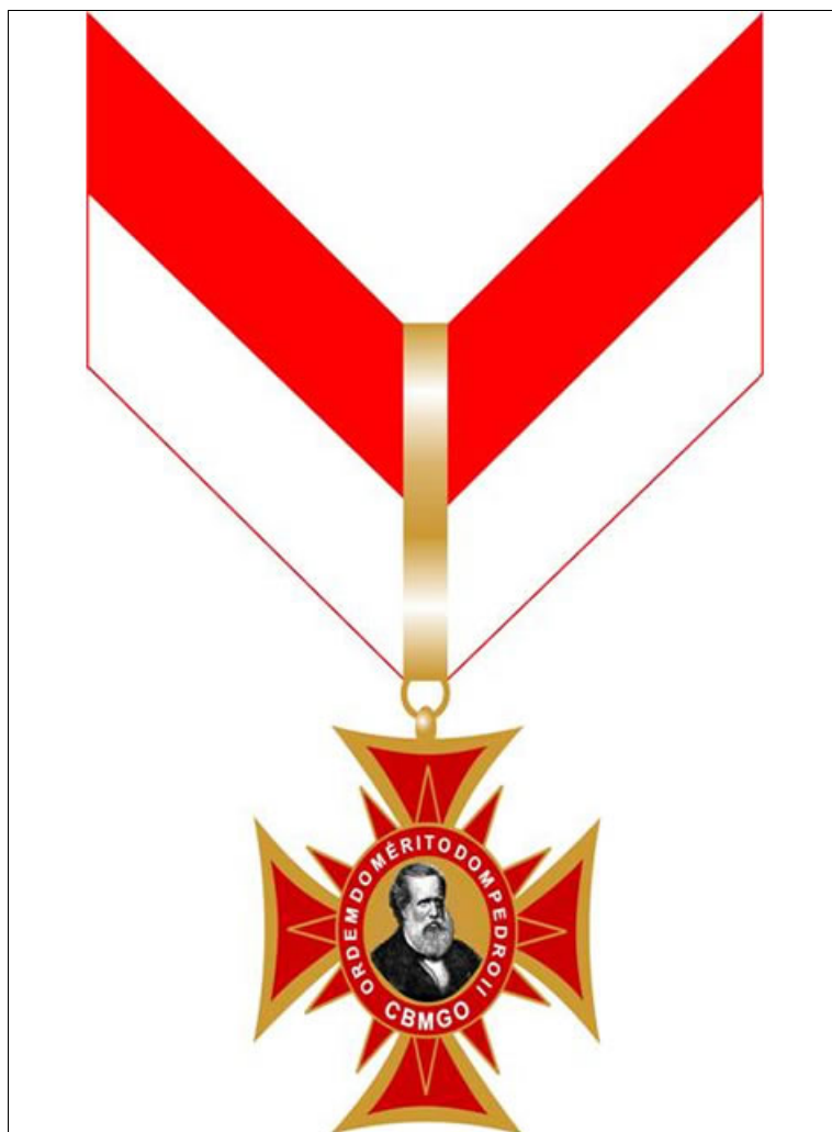
MEDALHA GRANDE-OFICIAL – VERSO