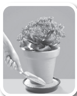
Coloque areia no pratinho dos vasos de plantas