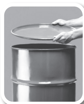
Feche bem tonéis e barris

Defenda sua família, seus vizinhos, sua comunidade. Não basta combater o mosquito. Precisamos eliminar seus criadouros e qualquer local ou recipiente que acumule água parada.