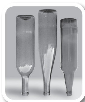
Esvazie e guarde garrafas sem uso de cabeça para baixo