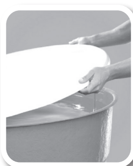
Tampe caixas d'água